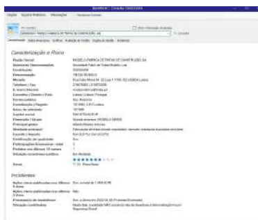
Caracterização da empresa