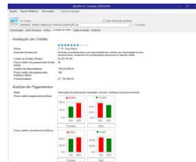
Dados económico-financeiro e evolução